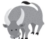
Савр 21.04 - 21.05

Аввали ҳафта каме серташвиш аст, ташаббусхоягон дучори монетаҳои ҷиддӣ мегарданд. Ҳамсафари ҳаёти дар пешравихоягон монета эҷод мекунад. Агар дар муносибатҳои оилавии шумо кайҳо боз нофаҳми пайдо шуда бошад, дар ин рӯзҳо ба мочарои калон мепечад.