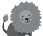
Асад 23.07 - 22.08

Кӯшишу талошхоягон баҳри бехтар сохтани вазъи зиндагӣ хуб аст, вале наздикон аз беаҳамиятии шумо дилгир мешаванд. Дар ин рӯзҳо дӯстону ҳамфикрони зиёд пайдо мекунад. Агар нафаре аз шумо кумак пурсад, рад накунад.