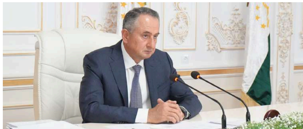
Давлаталӣ Саид, раиси вилояти Хатлон

Рӯзи 16-уми апрел дар толори мақомоти иҷроияи ҳокимияти давлатии вилояти Хатлон бо иштироки раиси вилоят Давлаталӣ Саид ҷаласаи ҷамъбасти натиҷаҳои рушди иҷтимоию иқтисодии вилоят дар се моҳи аввали соли 2024 доир гардид.