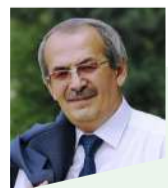
Абдуҷаббор СУРУШ, шоири рангинхаёли точик

- Дар Эрон низ ба шеърҳои ман тавҷҷӯҳ кардаанд, маҷмӯаи маро бо номи "Ширини ман, Ширин" чоп карданд. Бидуни ҳеҷ иқдому талошҳои худам. Яъне, шеъри арзандаро, пайдо мешаванд инсонҳое, ки қабул намоёндӯ кадр кунанд.