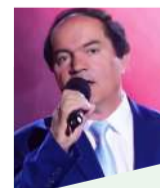
Хурсандмурод ЗАРИПОВ, Хунарманди шоистаи Тоҷикистон