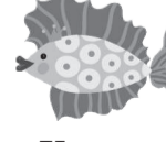
Ҳум 20.02 - 20.03

Дар ин ҳафта робитагон бо одамон душвор мегардад. Ростгӯӣ ва боисрории шуморо атрофиён ҳамчун дағалӣ ва густоҳӣ қабул мекунаанд. Ба вазъият нигоҳ карда, уҳдабаро ва ботаҳаммул бошед. Вазъи молиявиатон бехтар мегардад.