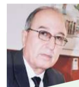
Сирочиддин ИКРОМӢ, нависандаи адабиёти муосир

Фузайлов аз соли 2005 то декабри соли 2011 дар "Ростов" ва "Локомотив"-и Маскав мураббӣ буд. Моҳи январ соли 2012 вай ноиби президенти "Локомотив" -и Тошканд оид ба масъалаҳои тарбияи бозигарон таъин гардида буд. Ӯ ҳамчунин тими миллии Тоҷикистон, дастаҳои "Истиклол" ва "Куктош"-ро тамрин додааст. Ҳақим Фузайлов дорои иҷозатномаи мураббигии дараҷаи PRO мебошад.