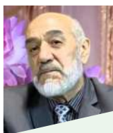
Нурулло АБДУЛЛОЕВ, Хунарпешаи мардумии Тоҷикистон