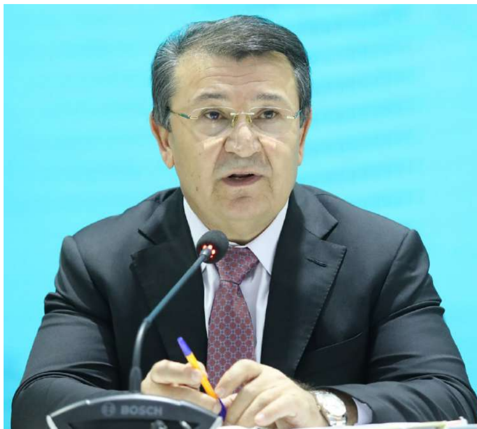
Чамолӣддин Абдуллозода, Вазири тандурустӣ ва ҳифзи иҷтимоии аҳолии Ҷумҳурии Тоҷикистон

Соли 2024 барои соҳаи тандурусти Тоҷикистон соли дастовардҳои назаррас гардид. Бо ворид намудани технологияҳои инноватсионӣ, таҷдиди муассисаҳои тиббӣ ва татбиқи барномаҳои пешгирии бемориҳои сироятӣ, сифати хизматрасониҳои тиббӣ ба таври назаррас беҳтар шуд. Ҳамчунин, тавассути дастгирии маъҷубон, пиронсолон ва оилаҳои камбизоат сиёсати ҳифзи иҷтимоӣ тавсеа ёфт. Такмили кадрҳои тиббӣ ва ҷорӣ намудани технологияҳои рақамӣ ба баланд шудани сатҳи касбияти мутахассисон ва дастрасии беморон ба хизматрасониҳои замонавӣ мусоидат карданд. Стратегияи рушди ояндаи соҳа низ равшан муайян шудааст.