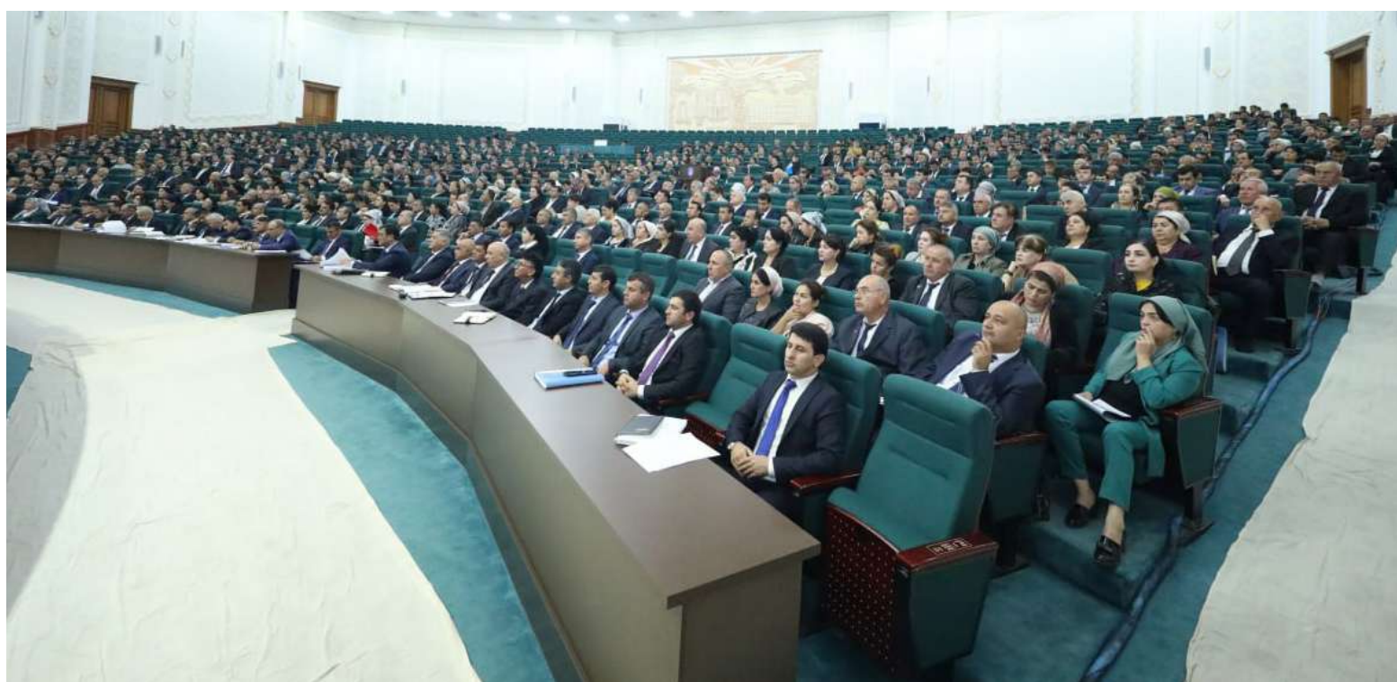
Аз маҷлиси ҷамъбасти фаъолияти 9-моҳаи Вазорати тандурустӣ ва хифзи иҷтимоии аҳоли

Ҳадафи мо ин аст, ки бо тақмили минбаъдаи инфрасохтор ва ҷорӣ кардани технологияҳои тиббиро ба сатҳи ҷаҳонӣ расонем. Стратегияи рушди соҳаи тандурустӣ дар солҳои 2024-2030 инчунин пешбини мекунад, ки мо тавассути ҷалби сармоягузориҳои иловагӣ ва ворид кардани таҷрибаҳои байналмилалӣ сатҳи хизматрасониҳо боз ҳам баланд бардошта, саломатии аҳолиро бехтар намоем.