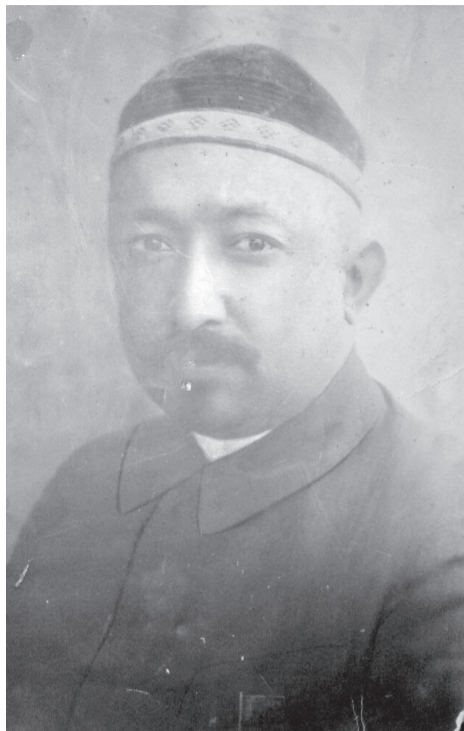
Зиндагиномаи мухтасари Абдулқодир Мухиддинов чунин аст:

Абдулқодир Мухиддинов соли 1892 дар Бухоро дар оилаи тоҷири калони пусти карокул ва пахта, сохиби фабрика, миллионер Мухиддин Мансуров (Мухиддини Мансурзода) таваллуд ёфтааст.