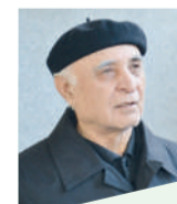
СОРБОН , Нависандаи халқии Тоҷикистон