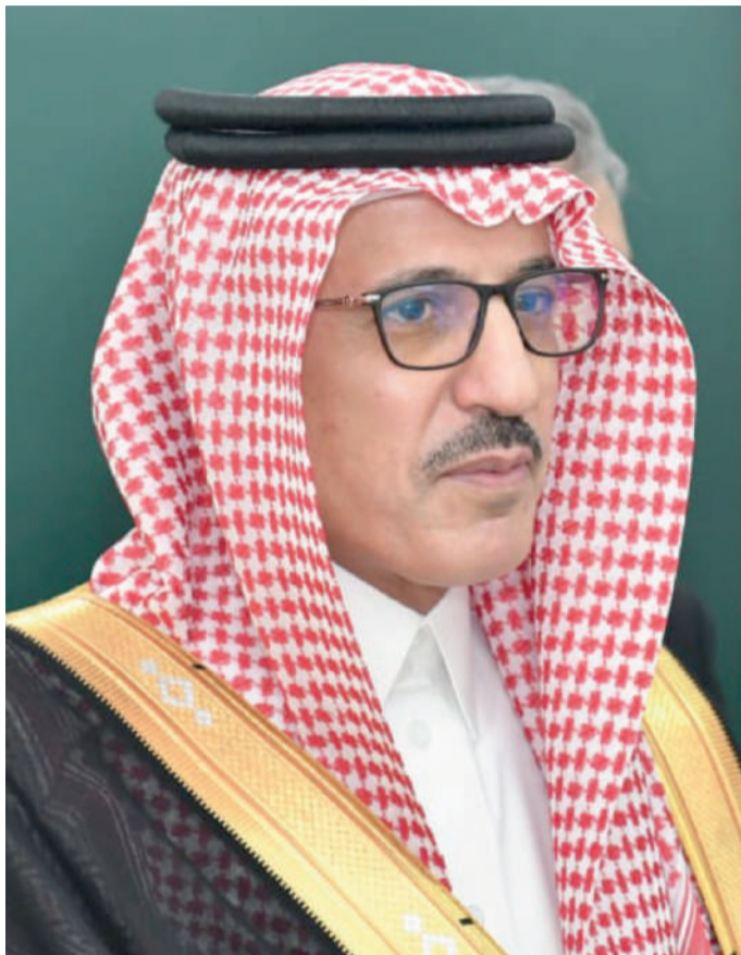
Валид бин Абдулрахмон ар-Решайдан, Сафири Шоҳигарии Арабистони Саудӣ дар Тоҷикистон

Чумхурии Тоҷикистон, ки дар минтақаи Мовароуннаҳр ҷойгир аст, аз замони қадим ғазвораи тамаддун ва таърих ба ҳисоб меравад. Дар ин сарзамини нек тамаддунҳои зиёде рушд намуда, ба ғанигардони фарҳанги ҷаҳонӣ саҳм гузоштаанд, донишмандону файласуфон дар он парвариш ёфтаанд, ки дар роҳи хизмат ба инсоният нақши муҳим доштад ва то ҳол низ доранд.