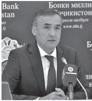
Фирдавс Толибзода, Раиси Бонки миллии Тоҷикистон

Фаъолияти Бонки миллии Тоҷикистон дар соли 2024 дар самти татбиқи самараноки сиёсати пулию қарзӣ, рушди ҳисоббаробаркунии ғайринақдӣ ва дигар воситаҳои молиявӣ идома ёфта, баҳри таъмини муътадиллии сатҳи нархҳои дохилӣ, устуворию қурби пули миллий, нигоҳ доштани қобилияти пардохтпазирии ташкилотҳои қарзӣ ва баланд бардоштани эътимоди аҳоли ба низоми бонкӣ, инчунин таъмини фаъолияти босуботу бехатарии низоми пардохт ва устуворию низоми бонкӣ чораҳои зарурӣ андешида шудааст.