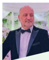
Шавкат ТОШМАТОВ , сарояндаи тоҷики муқими ИМА

- Сароянда будан дар Амрико осону ҳам душвор аст. Осонӣ ба кадом хотир? Ҳамватанони мо дар тӯйи чорабинӣ ва концертҳо хатман тақлиф месозанд. Душворӣ ба он маъност, ки дар Амрико танҳо бо сарояндагӣ рӯз гузаронидан мушқил аст.