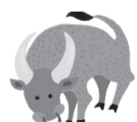
Савр 21.04 - 21.05

Дар ин ҳафта бештар ба қувва ва имкониятҳои худ таъя қунед. Интизори дастгирии дигарон нашавед, маҳз мустақилият шуморо ба натиҷаҳои хуб мерасонад. Дар муносибатҳои ошиқона эҳтимоли баҳсу ранҷиш вучуддорад, аз ин рӯ, сабрро пеша қунед.