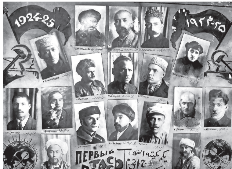
Нахустин роҳбарони ҶМШС Тоҷикистон, соли 1925.

Ӯ аз ҷумлаи одамоне буд, ки дар солҳои бисёр душвор зарурати рушди маорифро дарк мекард. Вақте ки Тоҷикистон ҳанӯз шабакаи густурдаи мактабҳо надошт, ӯ барои таъсиси муассисаҳои таълимӣ, омода кардани омӯзгорон ва нашри китобҳои дарсӣ талош мекард. Барои ман ҷолиб аст, ки ӯ