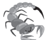
Ақраб 23.10 - 22.11

Ҳафтаи орому муътадил аст. Қорҳои зиёд доред ва эҳтимол барои анҷом додани баъзе нақшаҳо вақт кам ёбед. Бо вучуди серқорӣ, барои наздикон вақт ҷудо қарданро фаромӯш насозед. Агар ниати беҳтар қардани саломатиро дошта бошед, машқу ҳаракатро зиёд қунед.