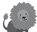
Асад 23.07 - 22.08

На ҳама пешниҳодҳое, ки ба шумо мерасанд, дар назари аввал ҷолиб менамоянд, вале баъзеи онҳо метавонанд дар оянда манфиати зиёд оваранд. Бисёр воқеаҳои ҳафта бо ташаббуси худ шумо рӯй медиҳанд, бинобар ин масъулиятро ба гардан гиред.