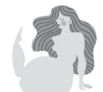
Сунбула 23.08 - 22.09

Кӯшиш қунед, ки дар ҳар вазъият паҳлуи мусбати рӯйдодҳоро пайдо намоед. Эҳтимол нафаре ба шумо ҳасад бурда, барои ҳалалдор кардани нақшаҳои тоҷи талош қунад, аммо оромиву хирадмандӣ шуморо аз мушқилол эмин меорад.