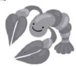
Саратон 22.06 - 23.07

Худро пурнерӯ ва фаволи эҳсос мекунад. Барои баъзеҳо сафарҳои шавқовар ё вохӯриҳои муҳим дар пешанд. Дар қору фаъолият имкониятҳои нав пайдо шуда, аксари нақшаҳои тоҷи бомуваффақият амалӣ мешаванд.