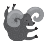
Ҳамал 21.03 - 20.04

Дар ин ҳафта бештар ба қувва ва имкониятҳои худ таъя қунед. Интизори дастгирии дигарон нашавед, маҳз мустақилият шуморо ба натиҷаҳои хуб мерасонад. Дар муносибатҳои ошиқона эҳтимоли баҳсу ранҷиш вучуддорад, аз ин рӯ, сабрро пеша қунед.