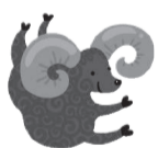
Ҳамал 21.03 - 20.04

Ин ҳафта рӯҳиятон болида шуда, барои бехтар намудани зиндагӣ имкониятҳои хуб пайдо мешаванд. Пешрафти қорҳо бештар ба фазои оромии гарми онла вобаста аст. Роҳбарон ва соҳибкорон метавонанд ғайридаштан хуб ба даст оранд.