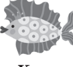
Ҳум 20.02 - 20.03

Одатан аз мушкилот роҳи баромад меёбед, аммо ин ҳафта баъзе масъалаҳои хурд метавонанд асабонияти шуморо зиёд кунанд. Дар ҷойи қор хушёр бошед ва ба ҳар суҳан зуд бо-вар накунед. Бо рақибон ва бадҳоҳон бо хирад муносибат кунед.