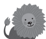
Асад 23.07 - 22.08

Ҳафта барои ворид намудани тағйироти мусбат ба зиндагӣ мувофиқ аст. Дар масъалаҳои қорӣ ва молиявӣ имкони беҳбудӣ пайдо мешавад. Муносибат бо ҳамсар ва наздикон хуб гардида, харидҳои дерингизор низ муяссар мешаванд.