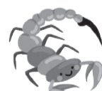
Ақраб 23.10 - 22.11

Пешниҳоди нави қорӣ метавонад нақшаҳои шуморо дигар қунад. Барои ба даст овардани даромади хуб захираҳои бештар лозим мешавад. Дар ҳаёти шахсӣ ташаббус нишон диҳед, то муносибатҳо бехтар гарданд. Охири ҳафта эҳтимоли хастагӣ ё нотобӣ вучуд дорад.