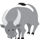
Сағр 21.04 - 21.05

Ин ҳафта рӯҳиятон болида шуда, барои бехтар намудани зиндагӣ имкониятҳои хуб пайдо мешаванд. Пешрафти қорҳо бештар ба фазои оромии гарми онла вобаста аст. Роҳбарон ва соҳибкорон метавонанд ғайридаштан хуб ба даст оранд.